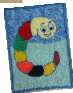
Совместные работы детей и родителей на выставку